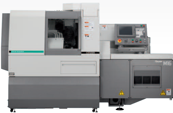
M 4 16 VIII